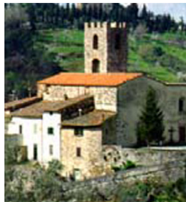
Nella foto: L'antico borgo di Bacchereto, sul fianco orientale del Montalbano