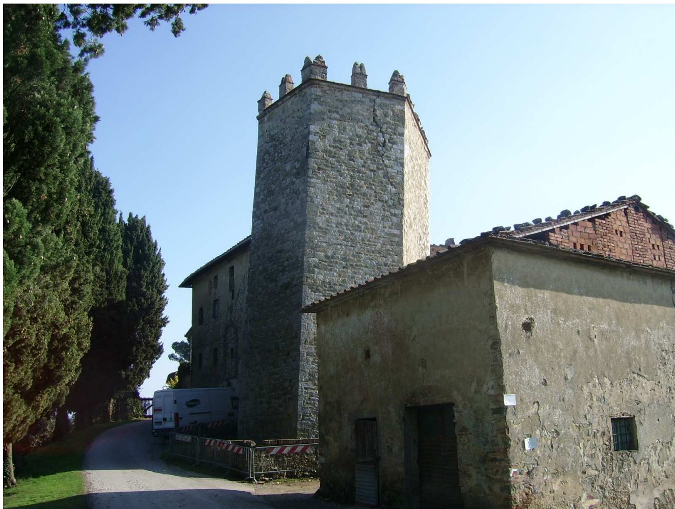
Documentazione fotografica foto 1