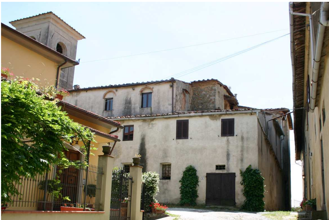
Documentazione fotografica foto 1