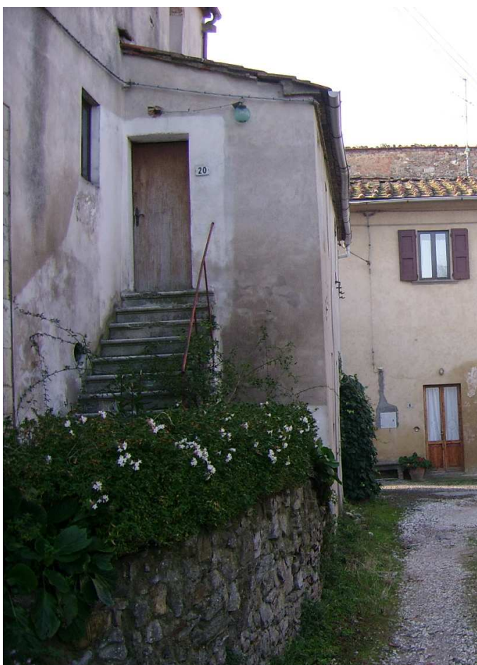
Documentazione fotografica foto 2