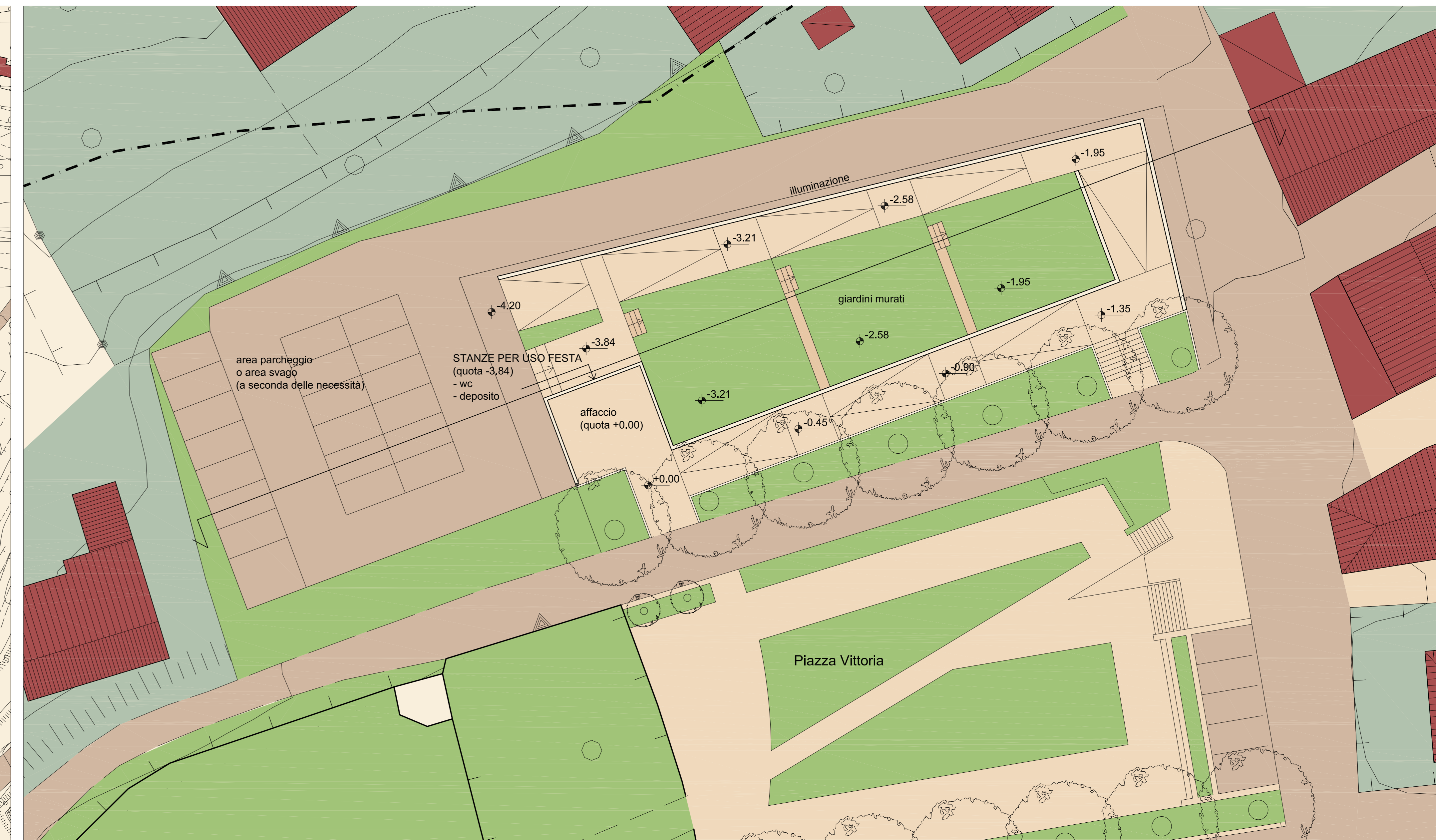
Planimetria scala 1:200