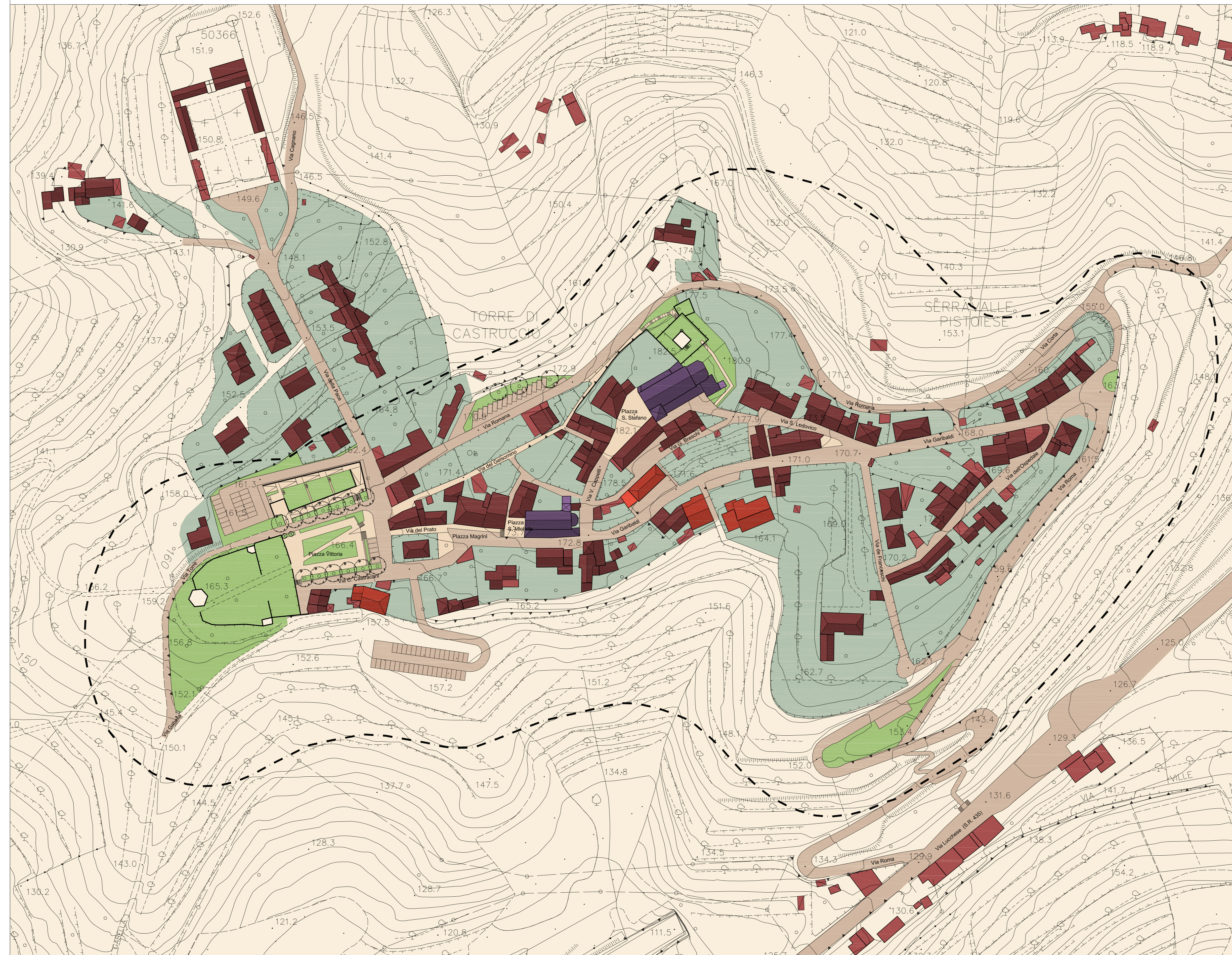
Planimetria scala 1:1000

--- Perimetro R.U. - ambito oggetto del Piano